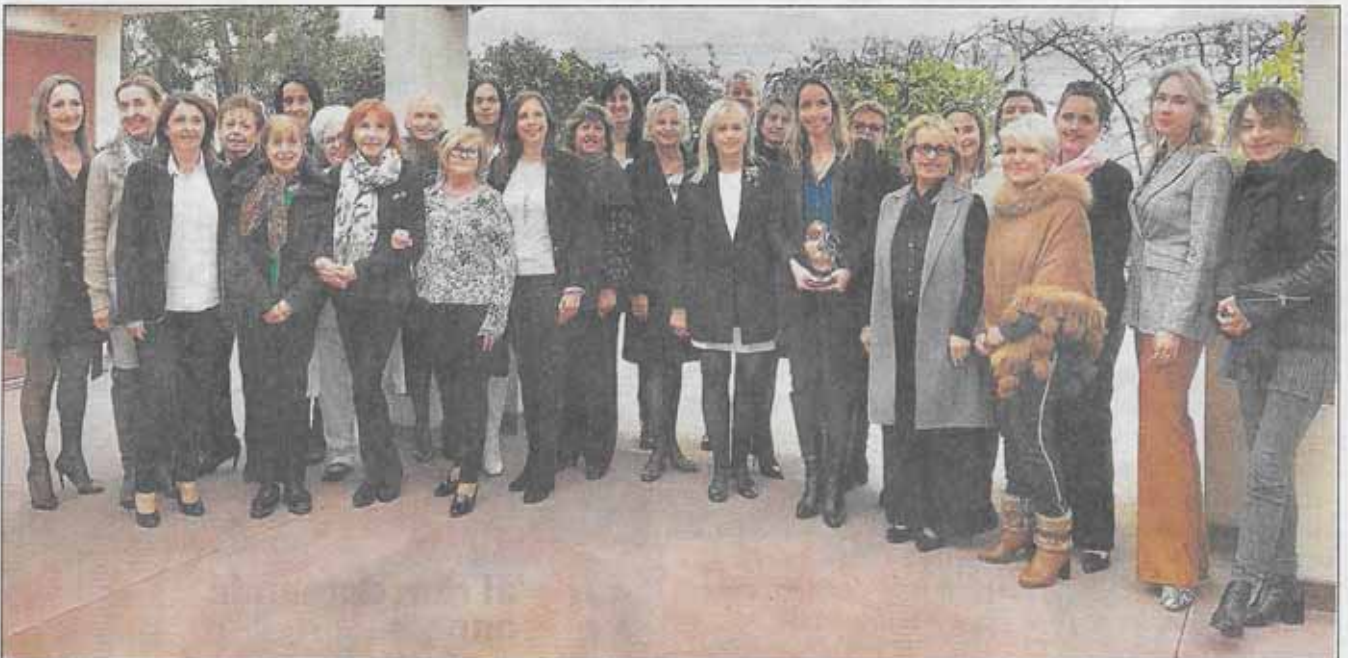
La directrice du CHPG a été choisie par l'association comme femme de l'année 2019.