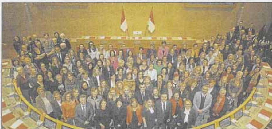
Les invités étaient pratiquement exclusivement féminines dans l'hémicycle.

Au chapitre des décisions sur ce dossier, le président Stéphane Valeri l'a rappelé : « La loi est claire, elle prévoit l'égalité entre femmes et hommes. Dans la réalité, les choses sont moins limpides. » Citant notamment un détail, sur la nomination par le gouvernement