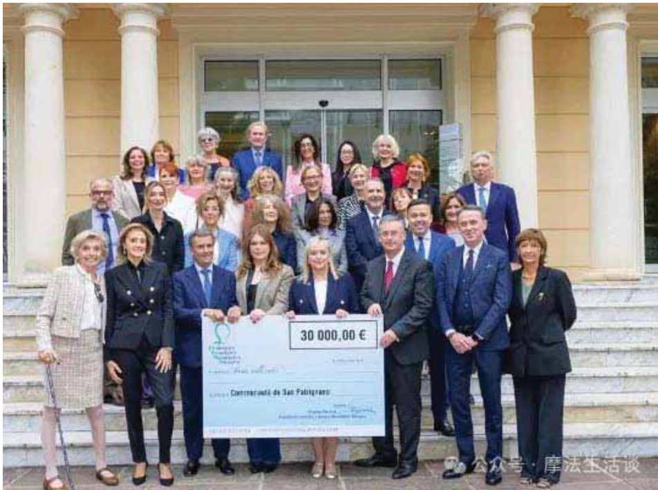
(FLMM协会会员及摩纳哥政要出席捐赠仪式)

*FLMM:Femmes Leaders Mondiales Monaco,摩纳哥世界女性领导者协会。