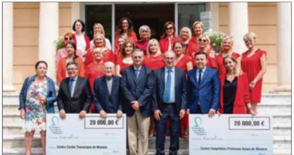
L'Association Femmes Leaders Mondiales Monaco devant le ministère d'Etat pour la remise de chèques.