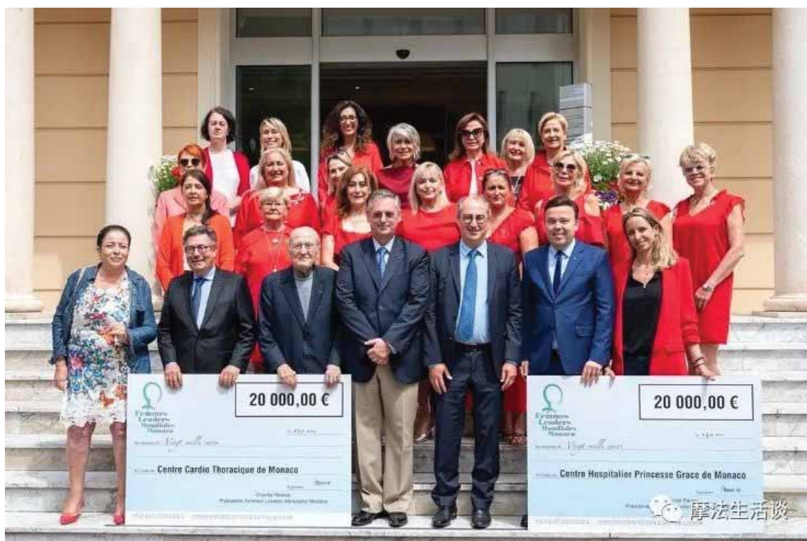
(2022年6月FLMM协会预防女性心脑血管疾病 手册捐赠仪式)

时至今日，FLMM协会拥有154名会员，以在摩纳哥工作生活的女性为主，不限国籍，不限职业，从女性企业家到政要，从医生律师到企业高管。如，摩纳哥国民议会副主席博科内=佩奇女士亦为会员之一。