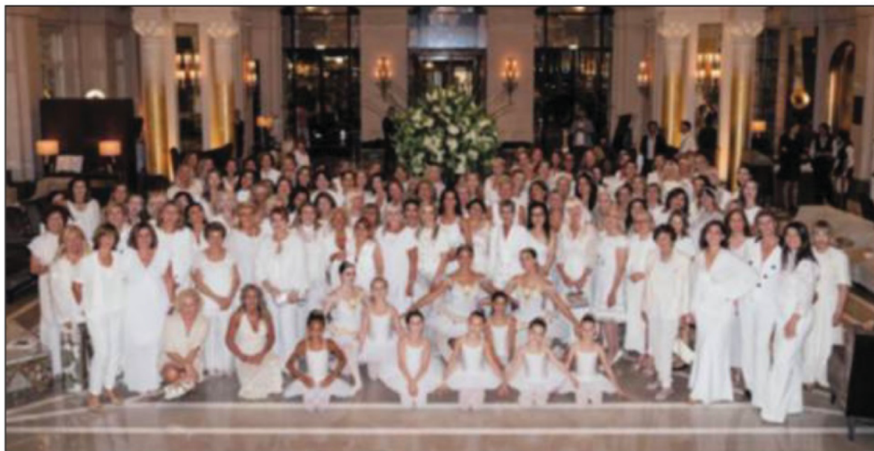
Une soirée blanche caritative s'est tenue à l'Hôtel de Paris.