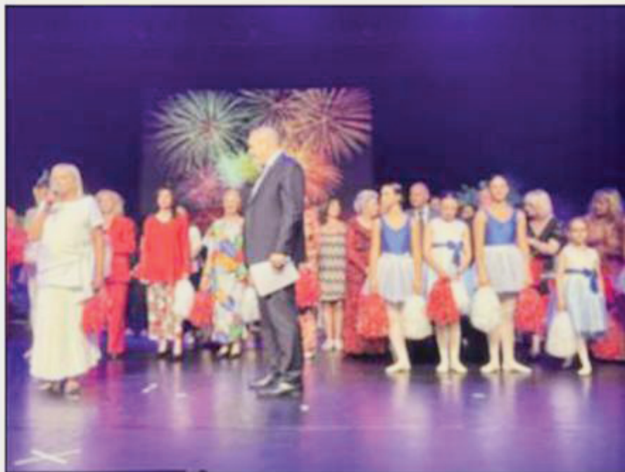
Le spectacle s'est tenu à l'espace Léo-Ferré.

Le spectacle fort de vingt tableaux a mis en vedette la compagnie artistique de l'association et les danseuses de l'école « Art et dance Monaco ». Ce sont 25 artistes amateurs et 24 bénévoles qui ont donné leur énergie, leur temps pour offrir aux spectateurs un moment de bonheur.