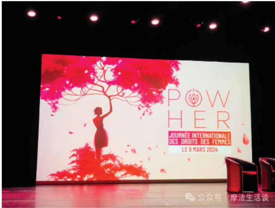
(首个PowHer女性权益宣传活动。愿以臂为枝，撑起自己的天空)

人们常说，女性的地位代表着一个国家的社会发展水平，而逐步推进男女平权，整整用了286年。摩纳哥也曾是一个男权至上的社会，但由于国土面积的限制，基本没有工业，注重IT化建设及提高女性在经济生活中的作用成为了新的发展方向。在经济方面，为女性孕期提供更为优厚的补助政策，生育3胎以上的女性享有提前退休的权益；在政治方面，随着90后的加入，志向从政的女性近男性的两倍。