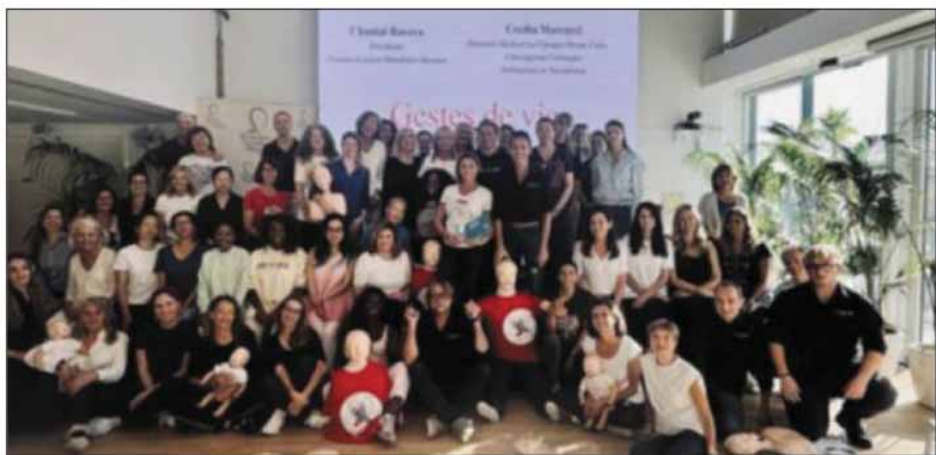
Soixante femmes ont été formées au massage cardiaque externe.