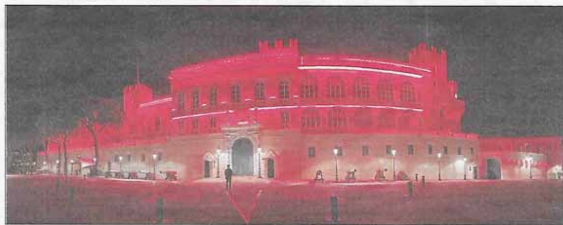
Jeudi soir, le Palais princier s'est teintée aux couleurs de la lutte contre les maladies cardio-vasculaires.