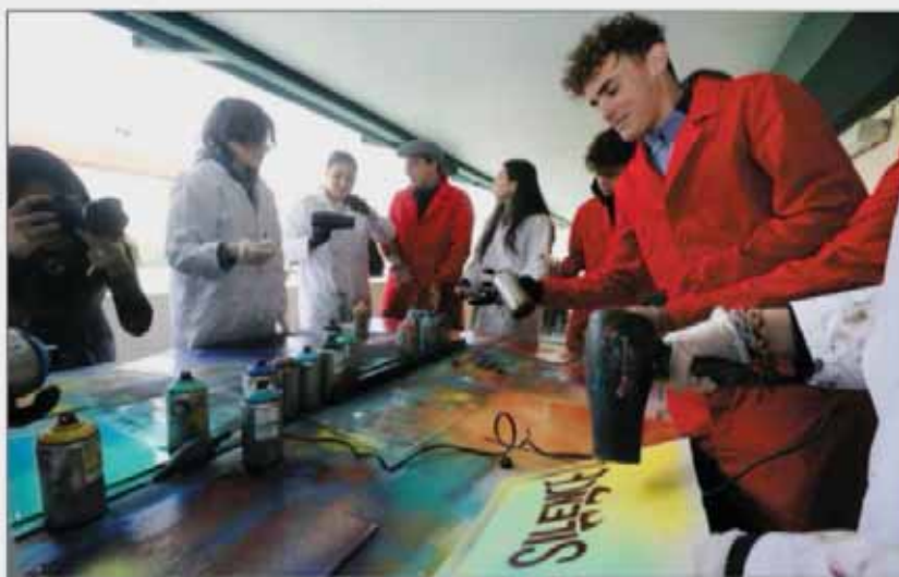
Les lycéens au travail sous les conseils de Mr OneTeas.