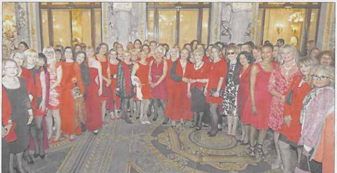
L'année dernière, le premier gala de Femmes Leaders Mondiales Monaco avait aussitôt reçu un très bel accueil.