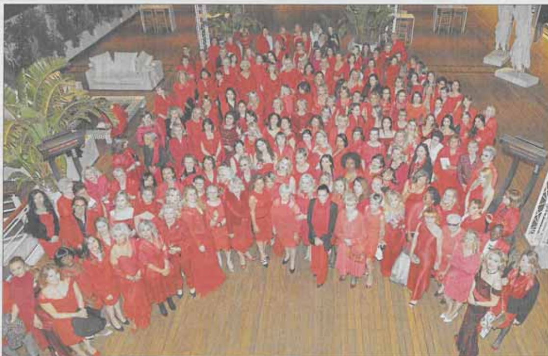
Toutes les femmes se sont rassemblées, autour de la princesse Stéphanie, sur la terrasse du Yacht-club de Monaco pour une grande photo souvenir.

En organisant la troisième soirée de gala « Sauvez le cœur des femmes », l'association monégasque inscrit son action dans la durée. Comme l'année dernière, 40 000 euros ont été récol-